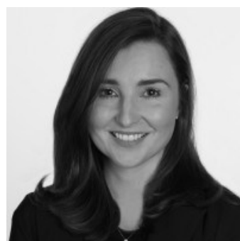
Aoife Lynam 教授 (教育)